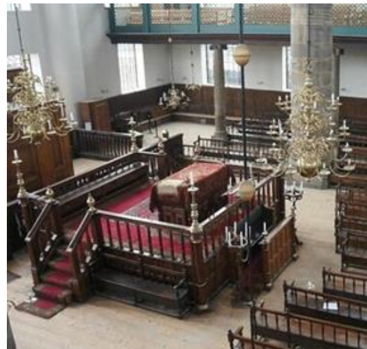
Bima in de Portugese Synagoge te Amsterdam

dochter van Jairus en de genezing van de naamloze vrouw (die in de traditie vereenzelvigd wordt met Veronica, die we kennen van de kruiswegstaties). Geloof en het volharden in het geloof vooral bij moeilijkheden stond tot nu toe centraal. Vandaag gaat het ook over geloof, over geloof in Jezus van Nazareth, de Zoon van de levende God. Ook de Heer zelf moest zich even schrap zetten bij het ervaren van de argwanende houding van de oud-dorpsgenoten. Hij kon er ook maar weinig doen, lezen we. Het zal voor de oud-dorpsgenoten van de Heer wel wat raar geweest zijn dat Hij op de bima stond en het Thora-onderrecht gaf. “ Hij is toch één van Maria en Jozef...? ”