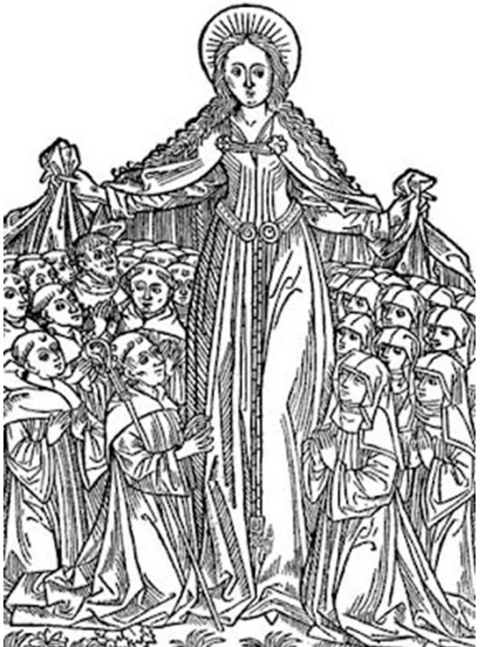
Heilige Maria, Koningin van alle Heiligen, Bid voor mij!