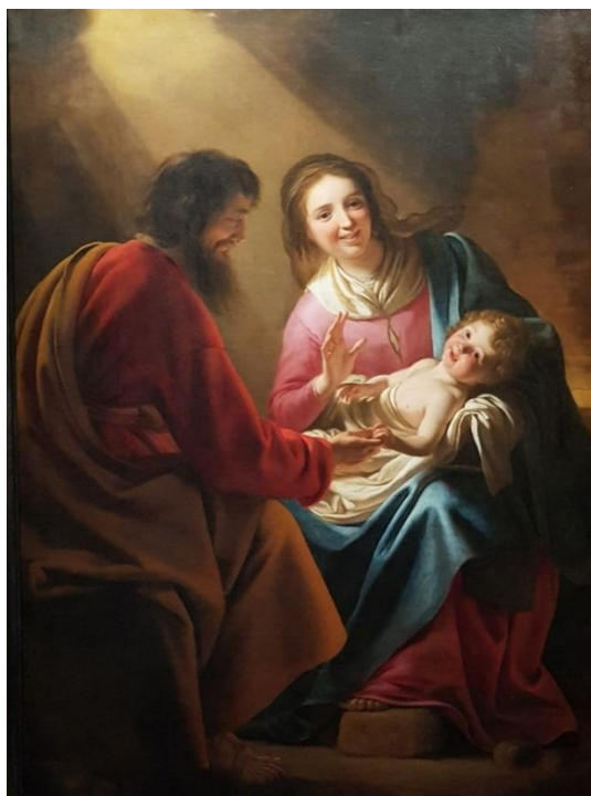
Gerard van Honthorst, 1632, Stedelijk Museum

het huis van mijn Vader moest zijn?” Zij begrepen echter niet wat Hij daarmee bedoelde. Hij ging met hen mee naar Nazareth en was aan hen onderdanig. Zijn moeder bewaarde alles wat er gebeurd was in haar hart. En met de jaren nam Jezus toe in wijsheid en welgevalligheid bij God en de mensen.