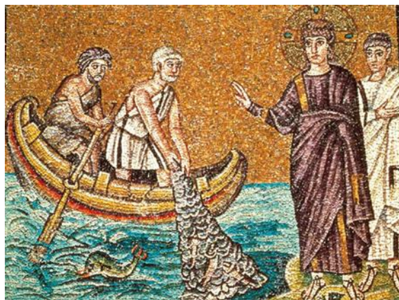
Mozaïek uit de 6 de eeuw, Basiliek San Vitale te Ravenna

niet bevreesd, voortaan zult ge mensen vangen.” Ze brachten de boten aan land en lieten alles achter om Hem te volgen.