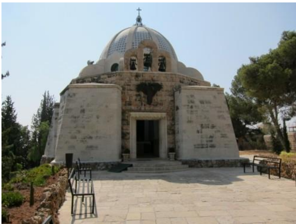
Kerk op het herdersveld in Bethlehem

Wat ook de moeite waard is, is een bezoekje aan het herdersveld met zijn mooie kapel. In die kapel zijn muurschilderingen met afbeeldingen van de tijd rond de geboorte van Jezus. Van de herders in het veld, de verschijning van de engel en ook het kindje met Maria en Jozef in de stal.