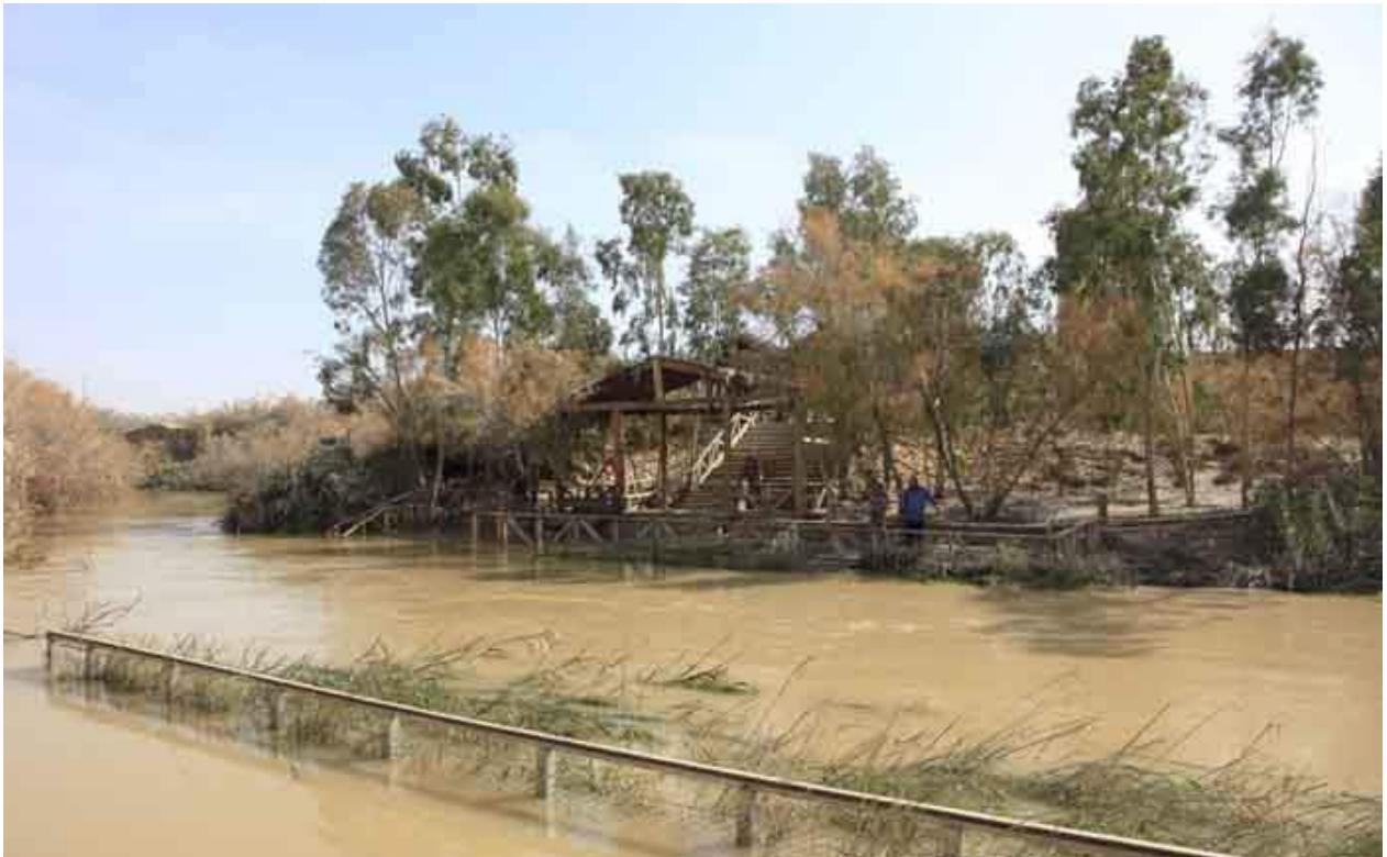
de doopplaats aan de Jordaan